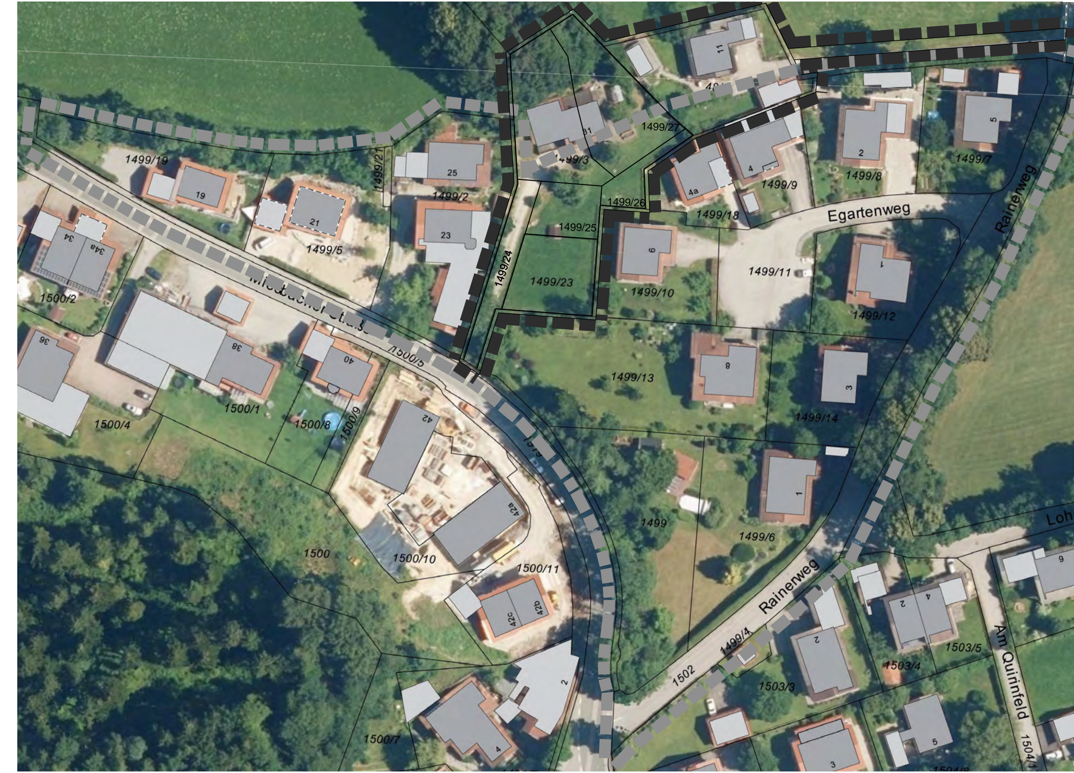
Ausschnitt Orthophoto M = 1 : 1000