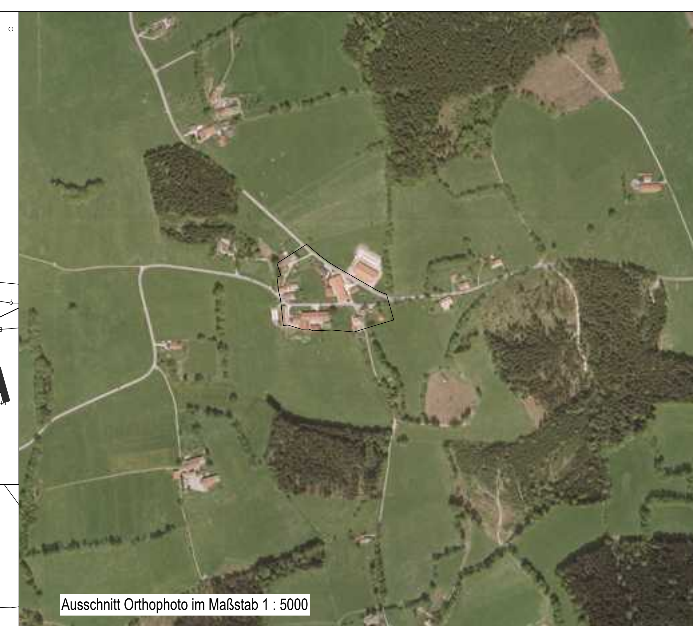
Ausschnitt Orthophoto im Maßstab 1 : 5000