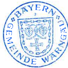
Klaus Thurnhuber 1. Bürgermeister

Ortsüblich bekannt gemacht durch Anschlag an der Amtstafel beim Rathaus Oberwarngau, sowie im Internet auf der Homepage der Gemeinde Warngau unter https://www.warngau.de/buergerservice-und-politik/bauen/bauleitplaene-in-aufstellung/