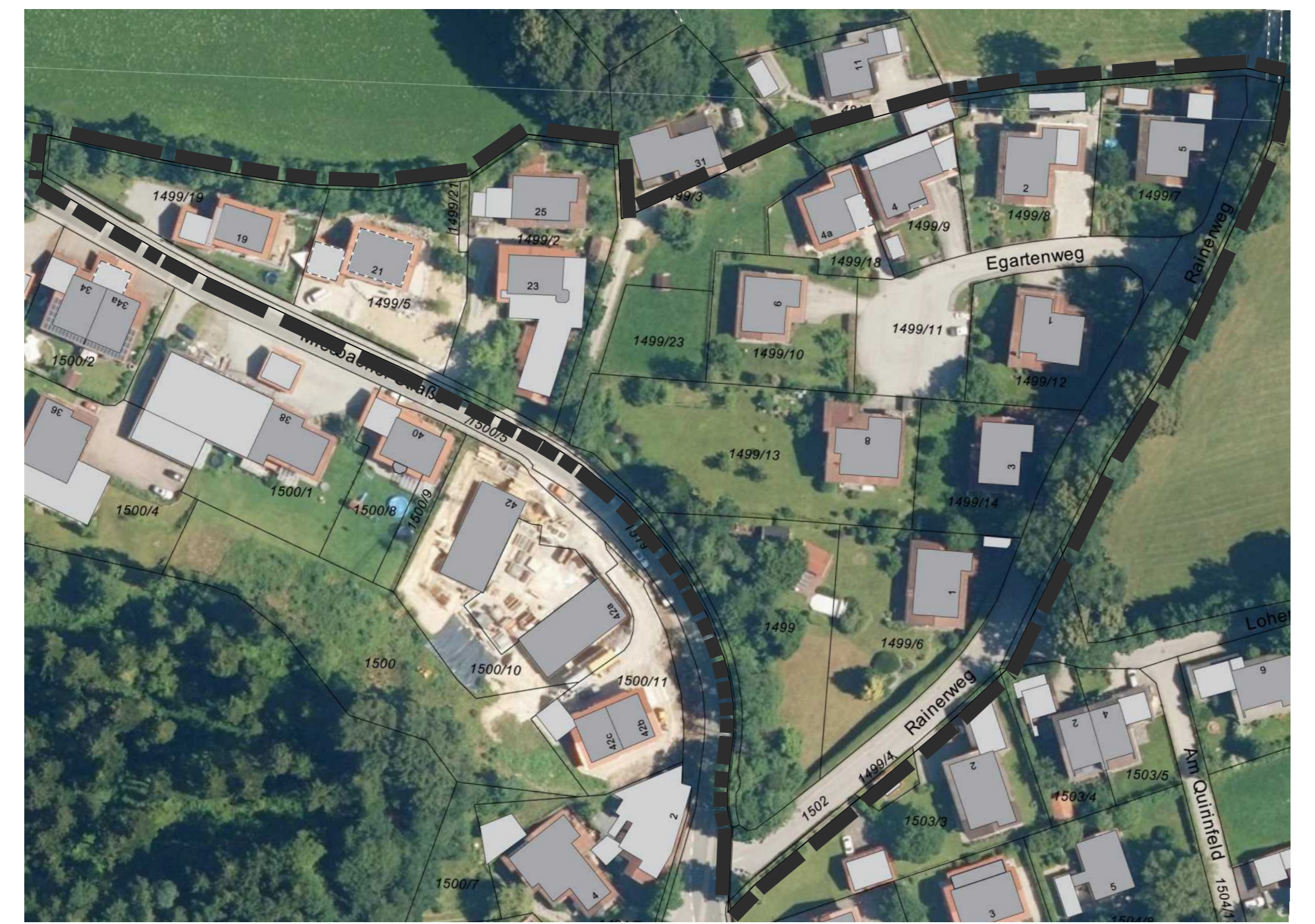
Ausschnitt Orthophoto M = 1 : 1000