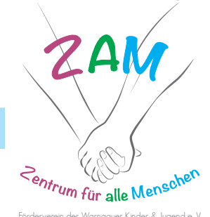
Förderverein der Warngauer Kinder & Jugend e.V.

Die Teilnehmerzahl ist bei den Angeboten mit Anmeldung begrenzt. *Der Unkostenbeitrag beträgt 3,00 Euro/5,00 Euro Der Jugendtreff findet in den Räumlichkeiten vom Hort, am Kapellenfeld 10, statt. Es gibt einen Kicker-, Airhockey-, u. Billardtisch und verschiedene Angebote. Für alle von der 4. bis zur 10. Klasse.